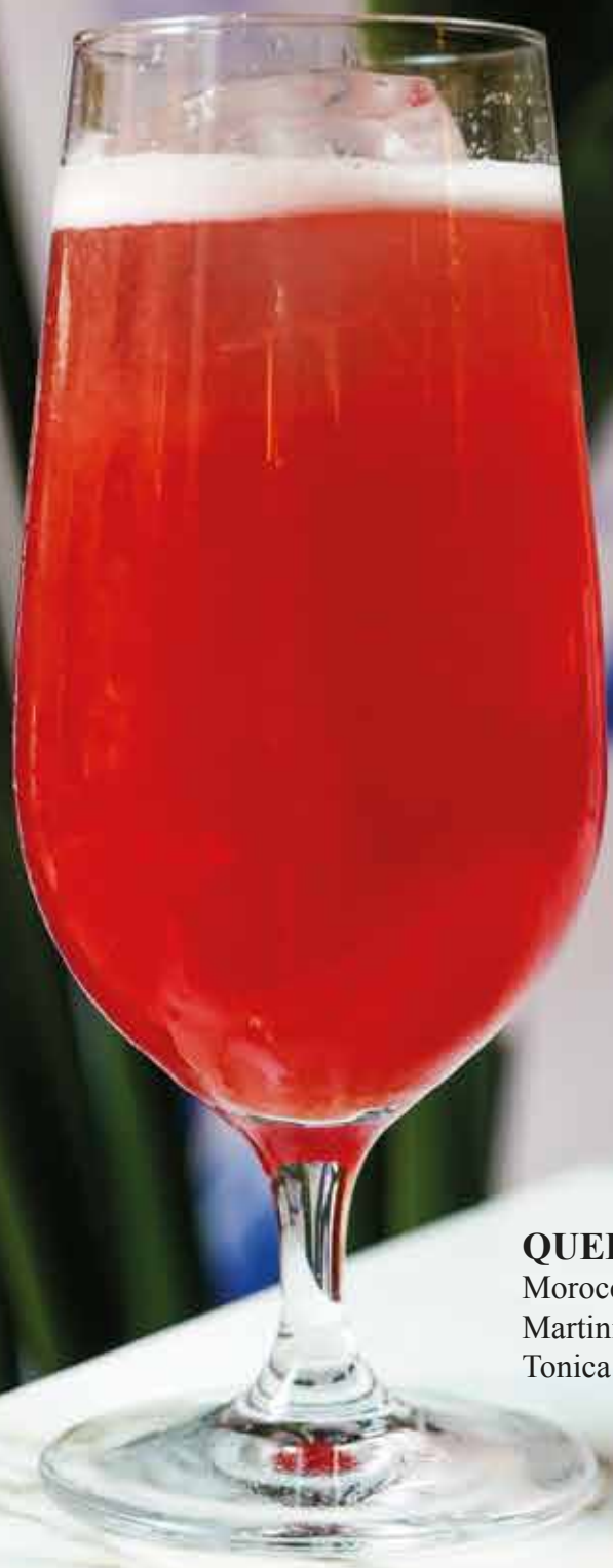
QUELLO Moroccan Cordial Martini Vibrante Tonica