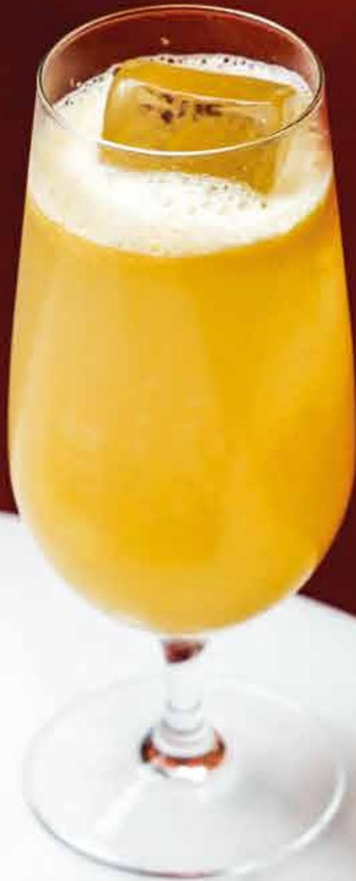
QUESTO Exotic Cordial Martini Floreal Ginger beer